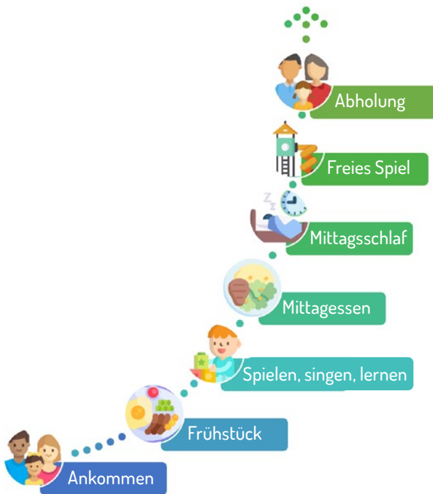
Abbildung 1: Vereinfachte Darstellung der Betreuungsmöglichkeiten in Deutschland