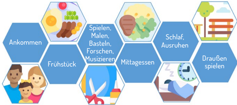
Abbildung 1: Vereinfachte Darstellung der Betreuungsmöglichkeiten in Deutschland